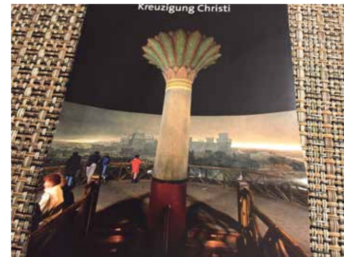
Panorama Museum innen.