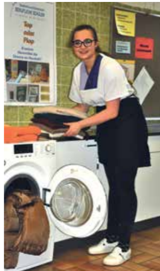
Daunenjacken können problemlos im Wollwaschprogramm gereinigt werden.

Vielleicht haben Sie einen Lieblingspullover aus Kaschmir – diesen sollten Sie besonders vorsichtig behandeln, um lange Freude daran zu haben.