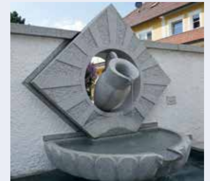
Granitbrunnen von Kleinzell

Anmeldung bis Freitag, 13. Mai, 12.00 Uhr unter Tel.: 08531/29717 (Graw) und 08532/921062 (Koblbauer)