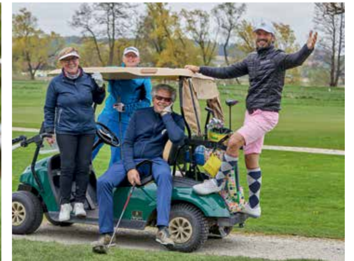
Viel Spaß hatten die Golfer bei ihrem Saisonstart auf dem Beckenbauer Golf Course.

Wollmützen, Handschuhe und dicke Jacken – beim Golf Opening mit dem EAGLES Charity Golf Club auf dem prestigeträchtigen Beckenbauer Golf Course in Penning erinnerte das Wetter mit kaltem Wind und Wolken verhangenem Himmel eher an St. Andrews in Schottland als an einen milden, niederbayerischen Frühling. Dennoch waren alle rund 90 Teilnehmer gut gelaunt, denn nach zwei Jahren ohne das obligatorische Golf Opening in Bad Griesbach freute sich jeder, endlich wieder gemeinsam Golf spielen zu können. Und zwar mit allem Drum und Dran.