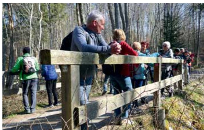
Beobachtungen im Biberrevier.