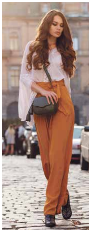
Luftige Looks durch weite Hosen und verspielte Blusen sind im Frühjahr und Sommer 2022 angesagt.

Zu den Farbtrends im Frühling und Sommer zählen insbesondere Orange und Pink. Entweder im Allover-Look oder kombiniert mit Blumen drucken oder geometrischen Mustern. Trendfarbe des Jahres 2022 ist Very Peri, ein sanfter Lila-Ton. Getragen wird er am besten mit natürlichen Tönen wie Creme und Beige. Wer insgesamt eher auf leichtere, gedeckte Farben steht, findet in den neuen Pastelltönen tolle Looks. Sie versprühen frühlingshafte Lebensfreude, etwa in Rose, Mint oder zartem Lila. Doch auch mit Looks ganz in Naturfarben – von