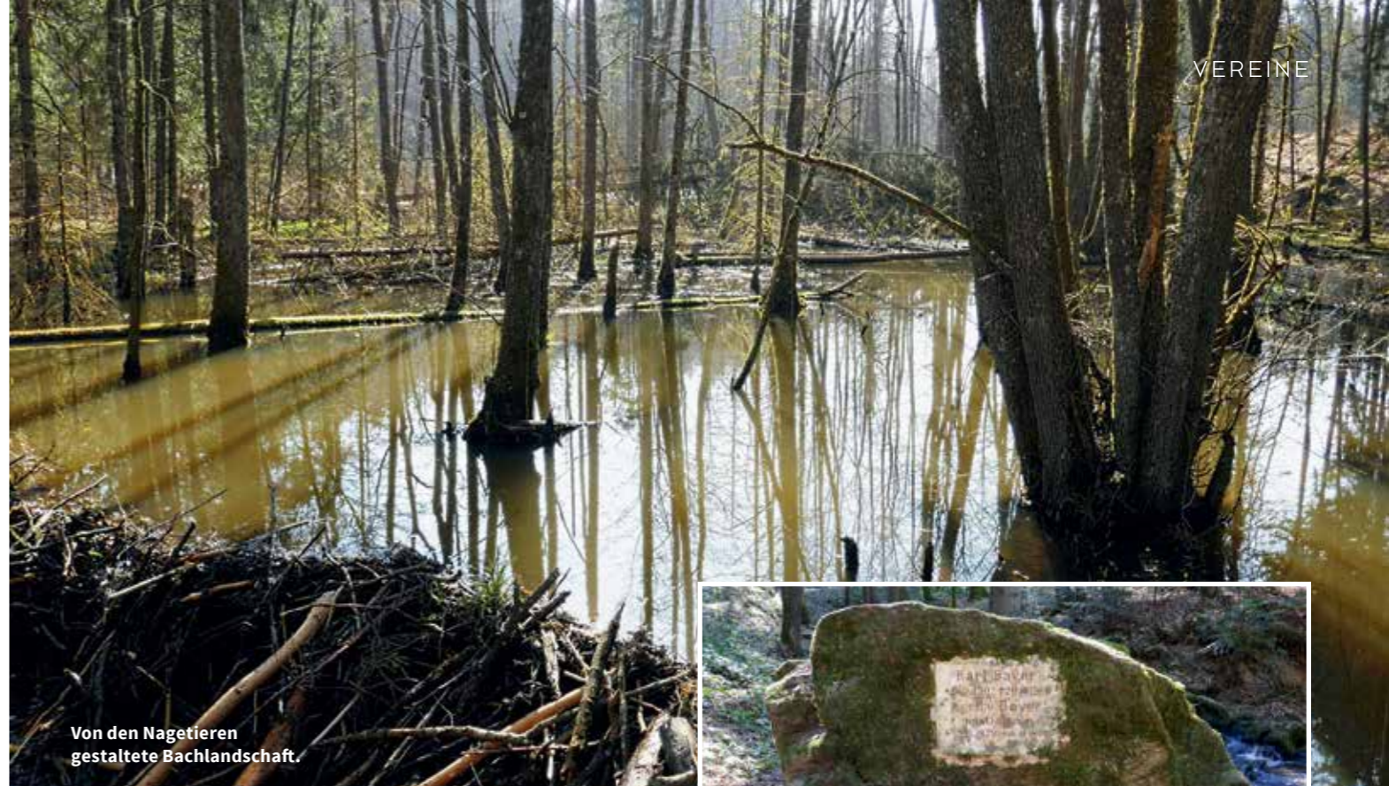
Von den Nagetieren gestaltete Bachlandschaft.