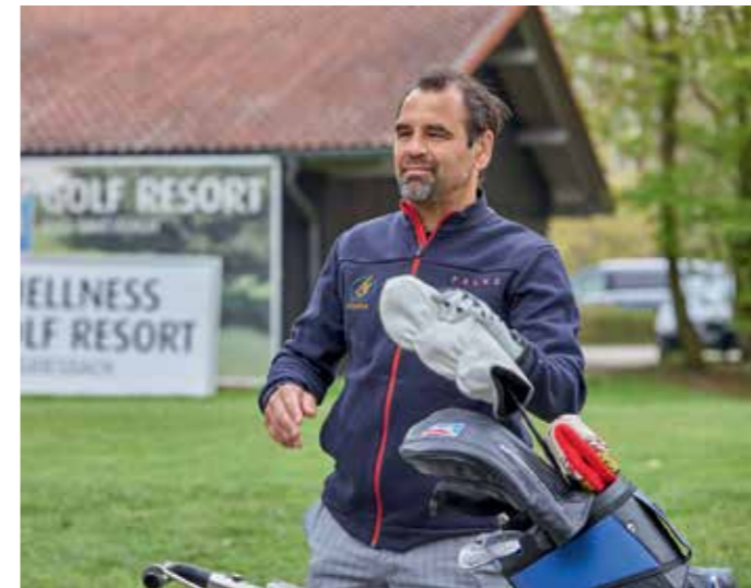
Schwingt gerne den Golfschläger: Ex-Kicker Ulf Kirsten (Bayer 04 Leverkusen).